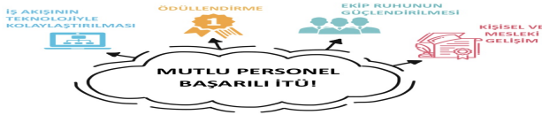
Şekil 6: Personel Motivasyonu ve Verimin Artırılması

Üniversitemizin İç Kontrol Eylem Planı kapsamında, tüm personele hizmet içi eğitim, protokol kuralları, kurum kültürü ve etik değerler konularında seminerler verilmektedir (Tablo Ek 1L, İç Kontrol Eylem Planı 2017 Yılı Gerçekleşen Eylemler Tablosu). Ayrıca, idari yöneticilere, etkili konuşma ve iletişim becerileri; analitik ve eleştirel düşünme; kurumsal inovasyon ve yenilikçi düşünme; çatışma, öfke ve stres yönetimi ile protokol yönetimi konularında eğitimler verilmiştir. Yürütülen bu eğitimler “İdari Birimlerin Modernizasyonu: Çalışma Kalitesinin ve Verimin Artırılması” projesi kapsamında incelenmiş ve daha da geliştirilmesi kararlaştırılmıştır (Şekil 6). Bu doğrultuda, idari personelin kuruma bağlılığını artırmak, kurum temsil sorumluluğunu en iyi şekilde yerine getirebilmek üzere gerekli profesyonel ve mesleki gelişimlerini sağlamak ve çalışma motivasyonunu yükseltmek amacıyla, sürekli eğitim felsefesi içeren bir Hizmet İçi Eğitim Yönergesi üzerinde çalışılmaktadır. 2018 yılında idari çalışanlar için, kişisel ve mesleki gelişim ile ilgili eğitimler ve güncel bilgilendirme seminerleri-kurslar planlanmıştır.