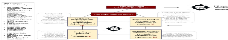
Şekil 4: Araştırma Yönetimi Kalite Döngüsü

İTÜ kalite politikaları çerçevesinde araştırma faaliyetlerinin, bütüncül ve sistematik bir yaklaşımla izlenmesi, değerlendirilmesi ve sürecin sürekli iyileştirilmesi planlanmıştır. Araştırma hedeflerinin gerçekleşmesinde temel dayanak noktası; üniversite hedef ve stratejilerinin araştırma birimleri ve akademik birimlere yaygınlaştırılması ve birimler bazında ölçülmesidir. Araştırma politikalarının ve stratejilerinin belirlenmesinde, Araştırma performansının izleme, değerlendirme ve raporlama süreçlerinde Araştırmadan sorumlu Rektör Yardımcısı başkanlığında İTÜ Araştırma Üniversitesi Komisyonu görev almaktadır (Şekil 4).