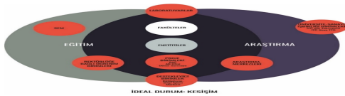
Şekil 3: Eğitim ve Araştırma Yönetişim Ağı

İTÜ’de, bir araştırma üniversitesi olarak belirlenen hedeflere ulaşmaya yönelik; tüm birimlerde; üniversite araştırma hedeflerinin paylaşılması, araştırma kültürünün yaygınlaşması, birimlerin birlikte ve uyumlu çalışmalarına yönelik yönetişimin sürdürülmesi çerçevesinde, Eğitim-Araştırma bütünleşik/ideal yapısı tanımlanmıştır (Şekil 3).