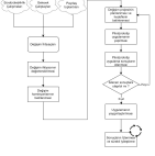
Şekil A.1.3.1. İTÜ Değişim Modeli

Bu işleyiş kapsamında daha önceki yıllarda belirlenen ihtiyaçlar çerçevesinde 2022 yılında uygulamaya alınan değişim projelerinden ve değerlendirme sonuçlarından örnekler aşağıda listelenmiştir: