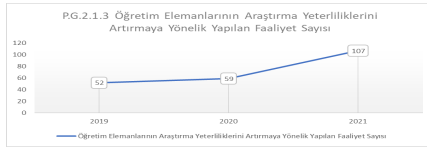
Grafik C.2.2.1. Öğretim Elemanlarının Araştırma Yetkinliklerini Artırmaya Yönelik Yapılan Faaliyet Sayısı

Gerçekleştirilen bu faaliyetlerin ulusal veya uluslararası ortaklı araştırma faaliyetlerine etkisi de yine Stratejik Plan Değerlendirmelerinde yapılmaktadır. 2021 yılı verilerine göre “P.G.2.2.1 Kamu veya özel sektör finansmanlı araştırma projesi sayısı 449, P.G.2.2.3 Uluslararası ortaklı/destekli proje sayısı 8, P.G.2.3.3. Araştırma amaçlı yurtdışına giden öğretim elemanı sayısı 28, P.G.4.4.5 Bölgedeki Kurumlarla Yapılan Ortak Çalışma Sayısı 41 olarak raporlanmıştır. Bu sayılar planlamada ortaya koyulan hedeflerin büyük ölçüde gerçekleştirildiğini göstermektedir ( Kant 7 ). Bu verilerin yıllara göre değişimleri de aşağıdaki grafiklere yansıtılmıştır.