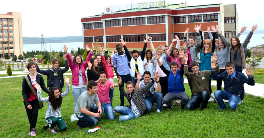
Foto 4. Üniversitemizde öğrenim gören yabancı uyruklu öğrencilerimizden bir görünüm.

Üniversitemizde öğrenim gören yabancı uyruklu öğrenci sayısı son iki yılda iki kat artmıştır. Bu yıl üniversitemize kayıt yaptıracak öğrencilerle birlikte tüm öğrenci sayımızın yüzde 3'ü yabancı uyruklu öğrencilerimiz tarafından oluşturulacaktır (Foto 4).