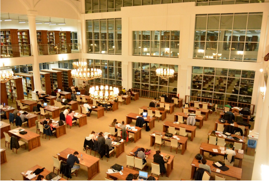
Foto 3. Terzioğlu Yerleşkesi merkez kütüphanesinden bir görünüm.

birimlerdeki öğrenci laboratuvarlarında kullanılan yeni teknolojik ürünler ile teşvik edilmektedir.