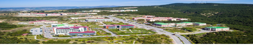
Foto 2. Çanakkale boğazına hakim radar sırtında kurulu Terzioğlu Yerleşkesi.