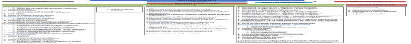
Şekil 9. Organizasyon Şeması

Operasyonel/akademik süreçler kadar idari/destek süreçlerine de önem veren DOÜ, verdiği bu önemi yukarıda listelenen stratejik amaçlar ve bu amaçlara varılıp varılmadığını ölçmek için kullanılan performans göstergeleri ile göstermektedir.