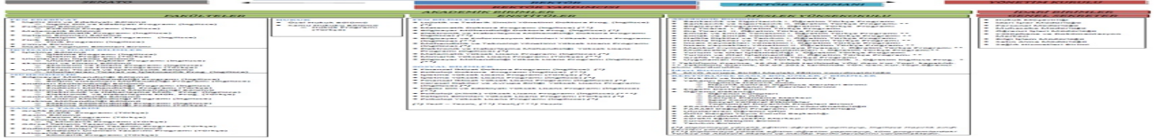
Şekil 6. Organizasyon Şeması

Operasyonel/akademik süreçler kadar idari/destek süreçlerine de önem veren DOÜ, verdiği bu önemi yukarıda listelenen stratejik amaçlar ve bu amaçlara varılıp varılmadığını ölçmek için kullanılan performans göstergeleri ile göstermektedir.