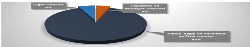
Şekil 5. 2020 yılı Üniversite Gelirlerinin Dağılımı

Erciyes Üniversitesinde finansal kaynaklarının yönetimine ilişkin süreçler tanımlanmış ve etkin bir şekilde uygulanmaktadır. 2020 yılı detaylı finansal tablosu Ek Tablo E.2.1’de, planlanan ve gerçekleşen bütçe gelirleri ise Ek Tablo E.2.2’de verilmiştir. 2020 yılı için planlanan bütçeden %5,95 daha fazla ek bütçe geliri sağlanmıştır. Bu artış önemli ölçüde diğer gelirlerden (%133,39) ve Üniversitenin teşebbüs ve mülkiyet gelirlerindeki artıştan (%23,88) kaynaklanmıştır. Bu gelirlerin dağılımı ise Şekil 5’te gösterilmiştir. Bu grafik incelendiğinde Üniversite bütçe gelirlerinin %89’u Alınan Bağış ve Yardımlar ile Özel Gelirlerden, %5’i Teşebbüs ve Mülkiyet Gelirlerinden ve %6’sının da Diğer Gelirlerden oluştuğu görülmektedir.