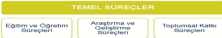
Şekil 3. Erciyes Üniversitesi Temel Süreçleri

Temel süreçler, Üniversitenin misyonunu gerçekleştirmek için faaliyette bulunduğu ana hizmet alanlarıyla ilgili süreçlerdir. Bu süreçler; Eğitim ve Öğretim, Araştırma ve Geliştirme ve Toplumsal Katkı olarak tanımlanmıştır (Şekil 3).