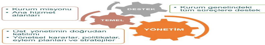
Şekil 1. Erciyes Üniversitesi Süreç Yönetim Yaklaşımı

Erciyes Üniversitesi kurum iş süreçlerinin yönetiminde Risk Tabanlı Süreç Yönetim Sistemini (RTSYS) benimsemiştir. 2018 yılı sonunda başlatılan RTSYS iyileştirme çalışmaları devam etmektedir.