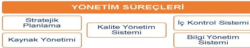
Şekil 2. Erciyes Üniversitesi Yönetim Süreçleri

Erciyes Üniversitesi yönetim süreçleri; Stratejik Planlama, Kalite Yönetim Sistemi, İç Kontrol Sistemi, Kaynak Yönetimi ve Bilgi Yönetim Sistemlerinden oluşmaktadır (Şekil 2).