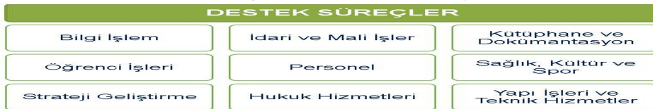
Şekil 4. Erciyes

Destek süreçleri, Üniversite genelindeki bütün faaliyetlere destek veren süreçlerdir (Şekil 4).