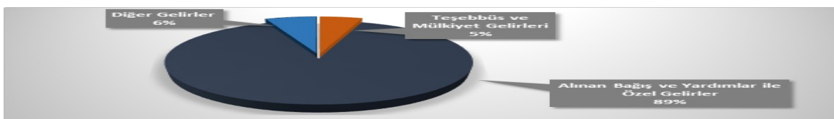
Şekil 7. Üniversite Finansal Kaynaklarının Dağılımı

Finansal kaynakların dağılımı Şekil E.7'de gösterilmiştir. Grafikten de görülebileceği gibi finansal kaynakların %89'u bağış ve yardımlar ile hazine yardımlarından, %11'i ise öz gelirlere (teşebbüs ve mülkiyet gelirleri ve diğer gelirler) oluşmaktadır.