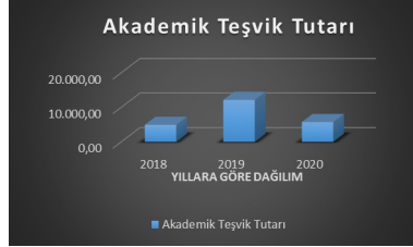
Tablo 2. Akademik teşvik tutarları – yıllara göre dağılımı

Meslek yüksekokulumuz bünyesinde yer alan programların farklı disiplinlere sahip olması akademik çalışmalarda da çeşitliliğin sağlanmasına katkıda bulunmaktadır. Bu bağlamda programlar bazında hazırlanan akademik çalışmalarla ilgili tablo aşağıdaki gibidir. Tabloya bakıldığında Aşçılık Programında bir bildiri ve 1 kitap bölümü, Dış Ticaret Programında iki bildiri, bir makale, Halkla İlişkiler ve Tanıtım Programında bir bildiri, dört makale, dört kitap bölümü ve bir kitap yazarlığı, Mimari Restorasyon Programında bir bildiri ve iki kitap bölümü, Moda Tasarımı Programında iki bildiri, Tıbbi Dokümantasyon ve Sekreterlik Programında iki bildiri ve bir makale çalışmaları hazırlanmıştır.