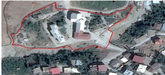
Şekil 2: Çölemerik MYO Yerleşkesi

Üniversitemiz ilk kurulduğundan beridir hizmet veren yüksekokulumuz 16.500 m 2 arazi üzerine kurulu 1 yüksekokul binası 20 dairelik lojman ve 1 ek derslikten oluşmaktadır. Bu yapılar 6458 m 2 kapalı alana sahiptir. Yüksekova Meslek Yüksek Okulu dışındaki tüm önlisans eğitimleri bu alanda sürdürülmektedir.