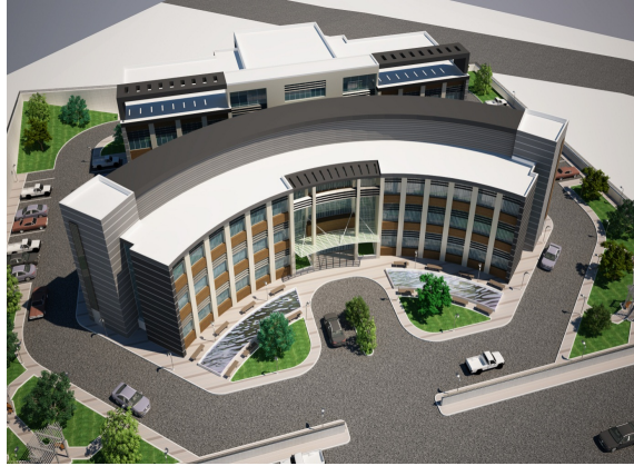
Şekil 3: Merkez Yerleşke Planı

2. Etap kapsamında yapılması planlanan binaların yapım ihalesi 21 Temmuz 2015 tarihinde gerçekleşmiş ve işin sözleşmesi imzalanarak yer teslimi yapılmıştır. Bu dönemde Teshin Merkezi Binası, Atölye Binası ve Rektörlük Hizmetleri Binası'nın temel kazıları yapılmıştır. Bu etap kapsamında yapılan işlere ait sözleşme, zeminde tespit edilen aksaklıklar yüzünden, bu alandaki iyileştirmelere öncelik verilerek yeniden düzenlenmek üzere 2016 yılında iptal edilmiştir.