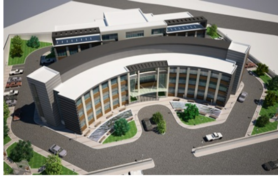
Şekil 5: Hakkari Tarihi Meydan Medresesi ve Kültür Evi

Hakkâri Tarihi Meydan Medresesi Hakkâri Merkez Biçer Mahallesinde bulunmaktadır. Van Kültür Varlıklarını Koruma Bölge Kurulu'nun 23.01.2017 tarih ve 1474 sayılı kararı ile uygun görülmüş olan Çevre Koruma Duvarı ve Kültür Evi Projeleri'nin uygulanması için; Doğu Anadolu Kalkınma Ajansı Tarafından bütçe tahsisi sağlanmış ve 2018 yılı Nisan ayı içerisinde ihale işlemleri tamamlanmıştır. Sözleşme aşamasında olan iş için, Mayıs ayı içerisinde yer teslimi yapılması ve yapım işine başlanması planlanmaktadır.