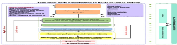
Şekil 1. Toplumsal Katkı Süreçlerinde İç Kalite Güvence Sistemi-PUKÖ Döngüsü

Aynı zamanda PUKÖ çevrimi olarak da adlandırılan bu süreç; Şekil 1'de Toplumsal katkı süreçlerinde iç kalite güvence sistemi olarak sunulmuştur.