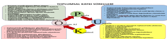
Şekil 2. Toplumsal Katkı Süreçleri

Aşağıda Şekil 2'de toplumsal katkı süreçleri birlikte verilmiştir: