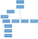
Şekil.1 Proje Genel Koordinatörlüğü Organizasyon Şeması

geliştirme faaliyetlerinin yönetimi, araştırma politikası, hedefleri, stratejisi çerçevesinde kurumsal amaçlar doğrultusunda bütünleştirici, sürdürülebilir ve olgunlaşmış uygulamalarla kurumun tamamında benimsenmiş ve güvence altına alınmıştır. Araştırma-geliştirme süreçlerinin yönetimiyle ilgili organizasyon şeması Şekil 1’de verilmiştir