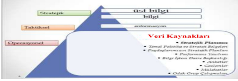
Şekil 2. KTÜ Stratejik Yönetim Sürecinde Stratejik Bilgi Kaynakları

KTÜ Yönetim Bilgi Sistemi Biriminin stratejik planda yer alan hedeflere ulaşma ve faaliyetleri hayata geçirme noktasında izlediği çözüm yaklaşımı Ek-12’de gösterilmiştir.