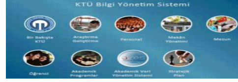
Şekil 4. KTÜ Stratejik Plan Bilgi Sistemi Sistemi Modülleri