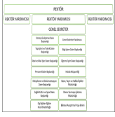
Şekil 2. Üniversitenin İdari Yönetim Yapısı