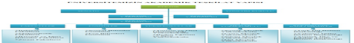
Şekil 1. Üniversitenin Akademik Yönetim Yapısı

Kurumumuz, stratejik hedeflerine ulaşmayı nitelik ve nicelik olarak güvence altına alan yönetsel ve idari yapılanmaya sahiptir. Akademik yönetim yapısı 2547 Sayılı Yüksek Öğretim Kanunu ile belirlenmiştir. Bu kanuna göre akademik yönetim yapısı Şekil 1'de, idari yönetim yapısı ise Şekil 2'de verilmiştir.