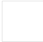
Şekil 2. Üniversitenin İdari Yönetim Yapısı

İç kontrol uyum eylem planı Üst yöneticinin 25/01/2012 tarihli ve 28-151 sayılı olurları ile yürürlüğe girmiştir. Halen altı ayda bir, birinci ve ikinci altı aylık olarak birimlerden iç kontrol uyum eylem planındaki eylemlerin gerçekleştirilip, gerçekleştirilmediğine ilişkin raporlar istenmekte olup, 2018 yıl sonu itibariyle yeni açılan birimlerimizin haricinde öngörülen eylemlerin %96 gerçekleştirilmiştir.