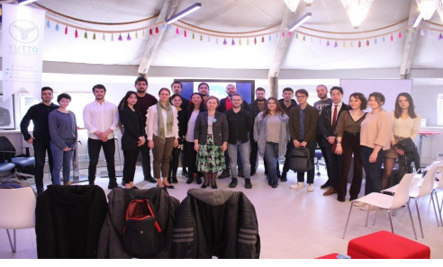
20 Mart Mühendislik Fakültesi